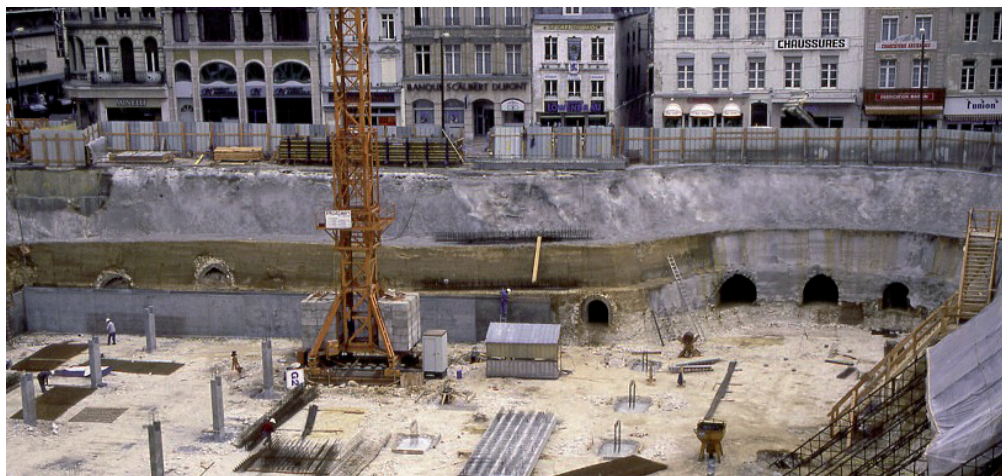
Exemple de cavités découvertes en centre ville au cours de travaux d'aménagement

Du fait de l'extension des villes, de nombreuses anciennes exploitations se trouvent désormais au droit de centres urbains historiques (Paris, Laon, Pontoise, Senlis, St-Emilion...) ou au sein de faubourgs de grandes agglomérations (Caen, Lille, Marseille...). Dans de tels environnements, la présence de ces vides impose aux autorités locales de fortes contraintes en termes d'aménagement.