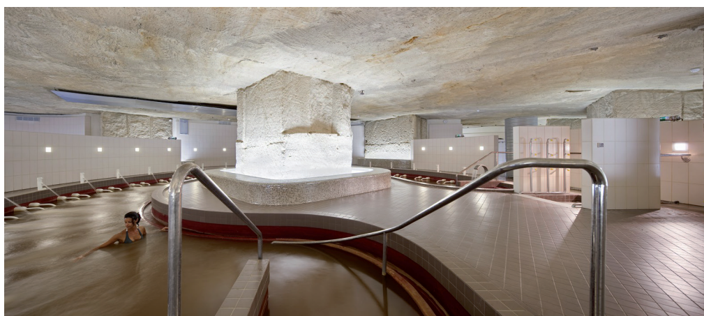
Thermes de Jonzac

La présente action visera à développer une synergie entre les différents acteurs impliqués dans une démarche ponctuelle de valorisation (collectivités, associations du patrimoine ...) ou dans le cadre de projets nationaux (Ville 10D) voire européens. S'appuyant sur divers retours d'expérience réussis (Laon, Arras, Jonzac...), les différents éléments clés pour assister les collectivités dans leur démarche seront analysés et mis à disposition (exigences techniques de sécurité, subventions mobilisables, mise en réseau pour valorisation des projets).