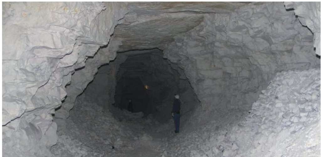
Galerie dans la craie

L'ensemble des régions françaises est concerné par ce phénomène, mais certains territoires s'avèrent plus particulièrement impactés (Nord, Picardie, Normandie, région parisienne, région bordelaise...). En Haute-Normandie, par exemple, on estime le nombre d'anciennes marnières à plus d'une quinzaine au km 2 .