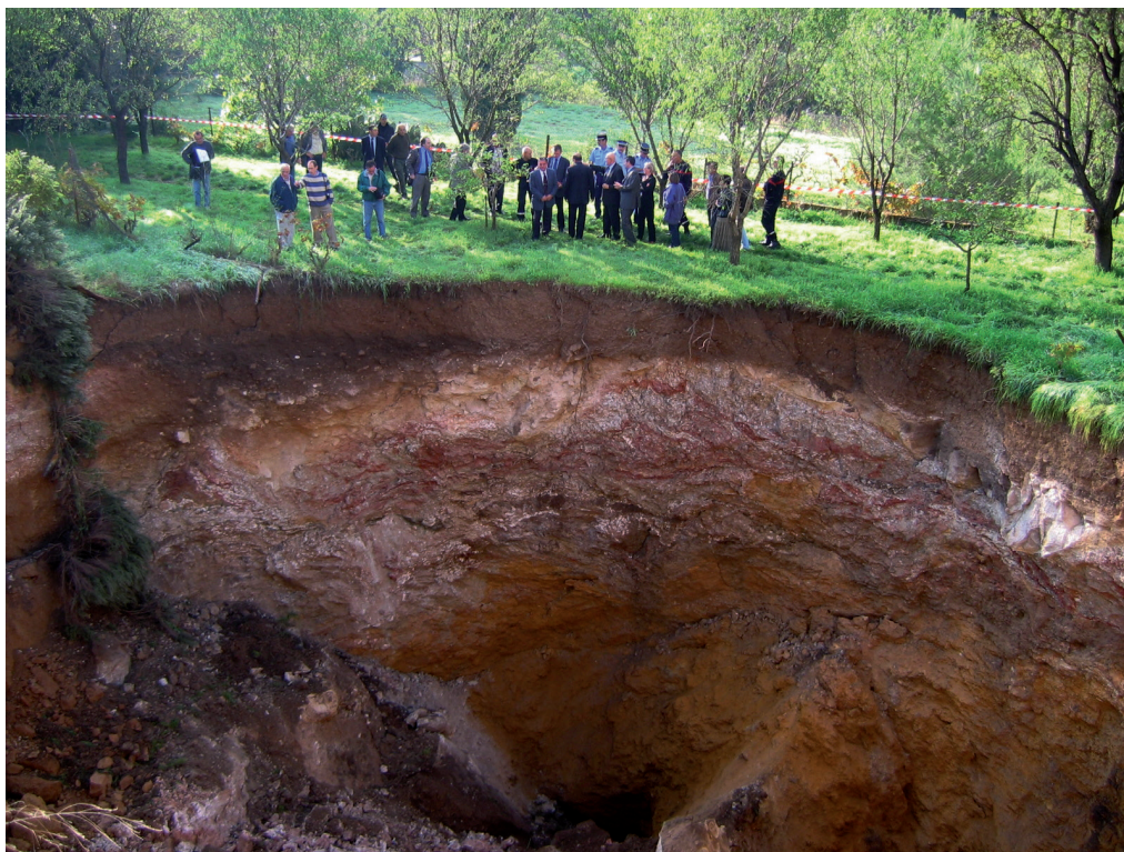
Constat d'un effondrement de terrain

De fait, les différentes parties prenantes (services déconcentrés de l'État, collectivités, aménageurs, particuliers) sont souvent confrontées localement à cette problématique mal connue et restent dépourvues d'outils et de méthodes de prévention du risque.