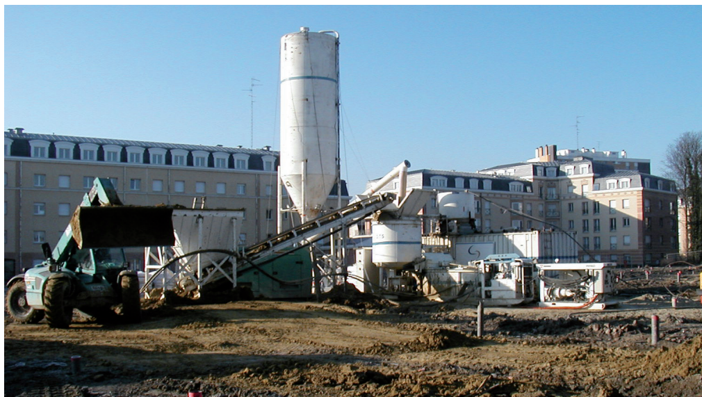
Travaux de comblement à Valenciennes

Favoriser l'émergence de stratégies locales de prévention du risque