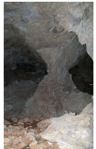
Evolution d'un pilier dans le temps