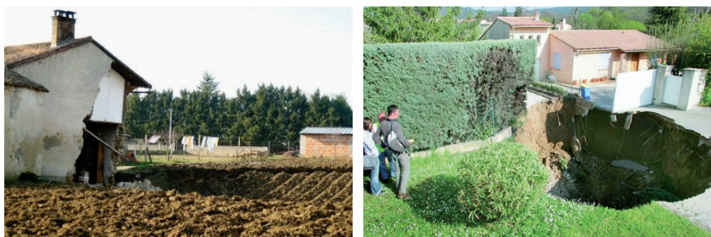
Vues d'effondrements récents : Effondrement d'une carrière souterraine en Gironde et effondrement naturel (gypsee) dans le Var

L'une des principales difficultés rencontrées dans la prévention des risques souterrains réside dans le caractère « caché » de l'aléa, qui engendre une méconnaissance du problème et une minimisation a priori des conséquences qui peuvent en résulter.